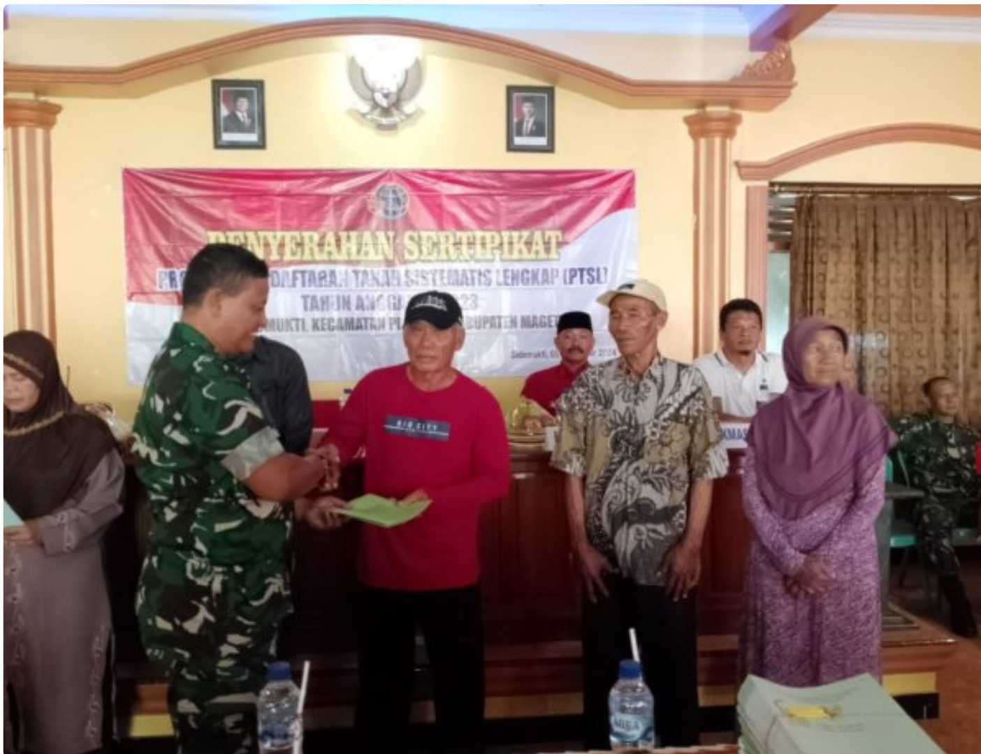
Danramil 0804/02 Plaosan Hadiri Penyerahan Sertifikat Program Pendaftaran Tanah Sistematis Lengkap (PTSL) Desa Sidomukti

PLAOSAN. - Desa Sidomukti melalui Badan Pertanahan Nasional (BPN)